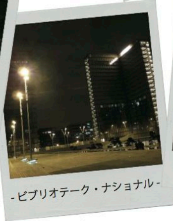
-ビブリオテーク・ナショナル-