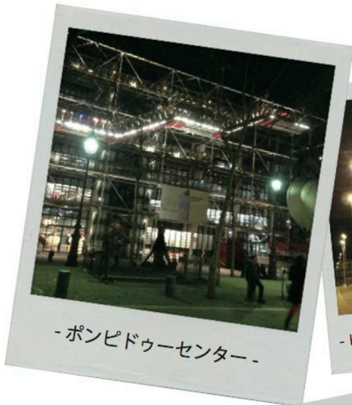
-ポンピドゥーセンター-