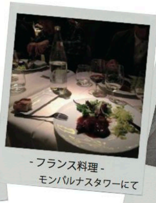
-フランス料理- モンパルナスタワーにて