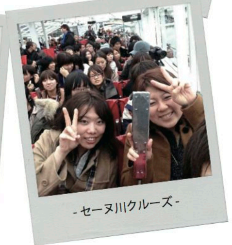
-セーヌ川クルーズ-

今回の旅は、自身にとって初めての海外旅行でした。先生方のご指導もあり、興味のある建築や街並みについて、さらにはその文化の違いを身体で感じることができました。