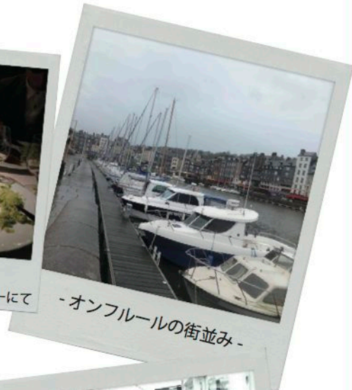
-オンフルールの街並み-