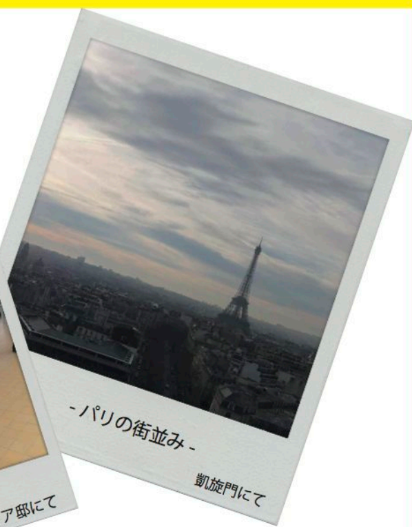
-パリの街並み- 凱旋門にて