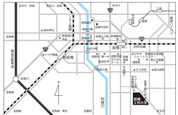
● JR両毛線前橋駅からバスで約10分 前橋工科大前下車