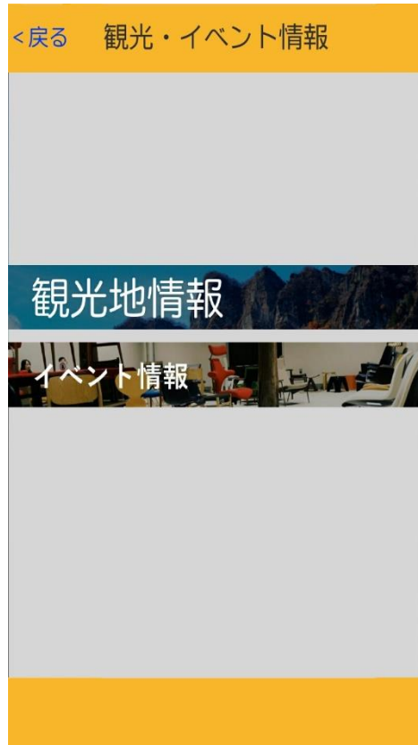
観光イベント情報