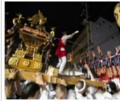
まつり・イベント情報